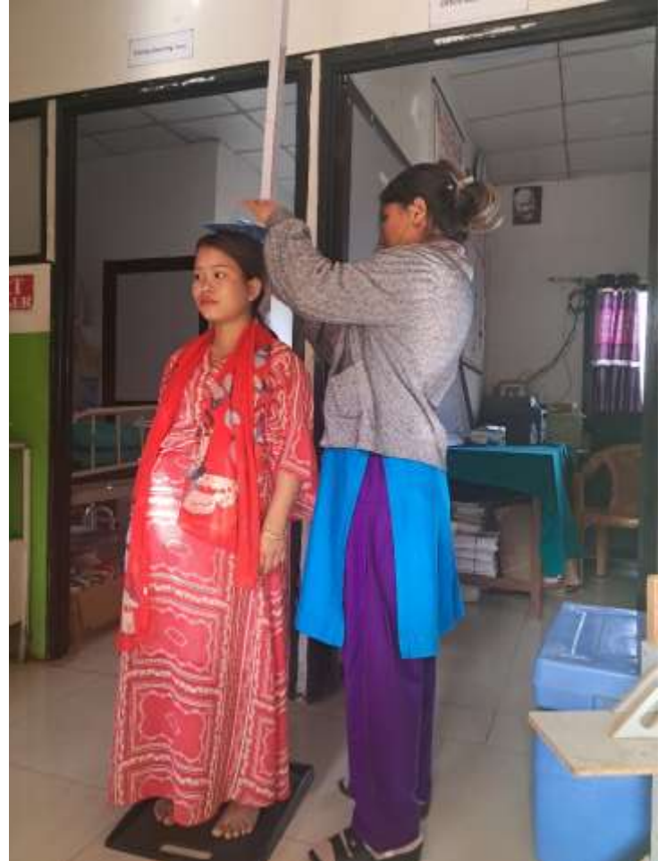
गर्भवती महिलाको उचाईको नाप लिंदै @ ताक्लुङ्ग स्वास्थ्य चौकी, गोरखा

मुस्ताङ सामुदायिक आँखा केन्द्र र थासाङ गाउँपालिकाको संयुक्त आयोजनामा लेते प्राथमिक स्वास्थ्य केन्द्रमा निशुल्क आखा शिविर संचालन भएको छ । १२८ जना सेवाग्राहीले सेवा लिएका थिए, जसमध्ये महिला ७३ र पुरुष ५५ जनाले आँखा परिक्षण भएको र यस शिविरमा प्राविधिक र औषधि मुस्ताङ सामुदायिक आँखा केन्द्रबाट निःशुल्क वितरण गरिएको थियो भने ४९ जनालाई थासाङ गाउँपालिकाले निःशुल्क चस्मा वितरण गरेको थियो ।