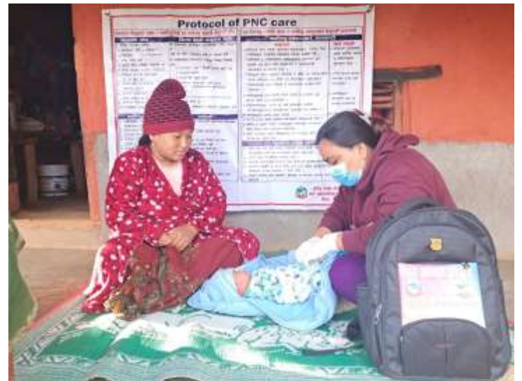
ताकलुङ स्वास्थ्य चौकी, गोरखा

- आगोले पोलेको घाउलाई सफा कपडाले छोपेर तुरुन्तै नजिकको स्वास्थ्यमा संस्थामा लैजाने ।